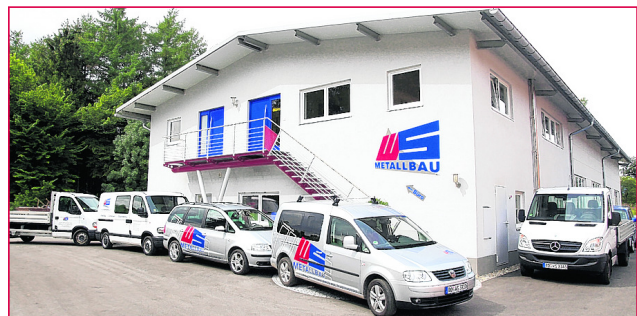
Das Firmengebäude mit Fertigungshalle in Reichenhart.

So wurden z.B. die Metallarbeiten am Neubau des Hauptzollamts Rosenheim und der begehbare Glassteg über das wertvolle Intarsien-Parkett im Kaisersaal des alten Schloss Herrenchiemsee ausgeführt.