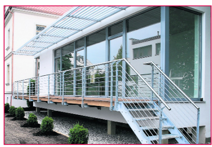
Erst kürzlich fertig gestellt: die neu gestaltete Villa Rosa am Kunstmühl-Gelände.